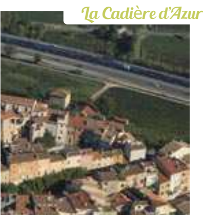
La Cadière d'Azur