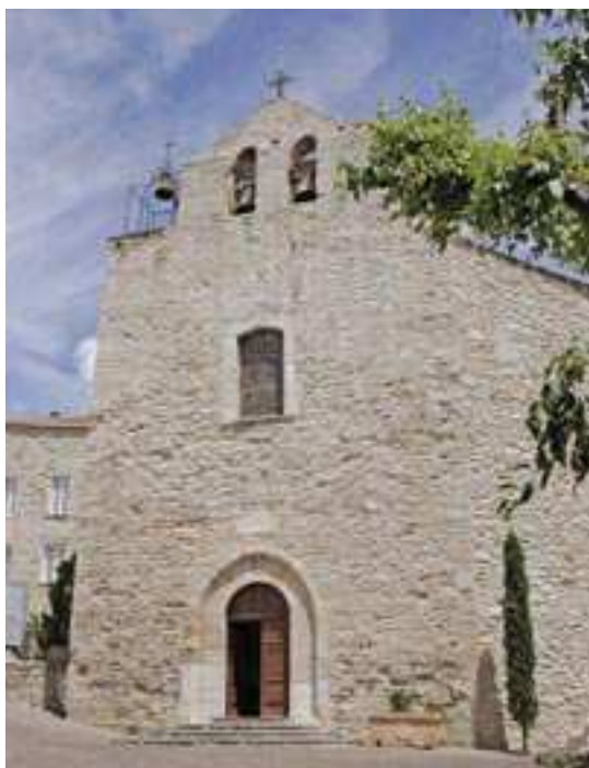
Le clocher-mur de l'église St Sauveur au Castellet (XII e siècle)

L'année 2015 était centrée sur la période médiévale. Une exposition synthétisant les grands événements culturels et historiques du territoire national, régional et intercommunal du V e au XV e siècle a été proposée au public.