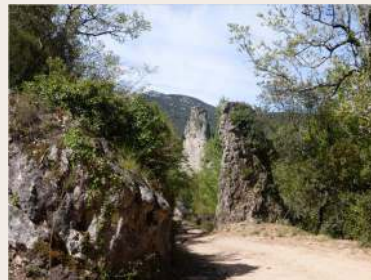
Cheminement dans les aiguilles