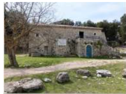
Bergerie (abri du Siou-Blanc)