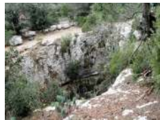
Vue sur l'aven