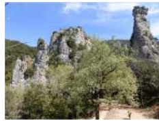
Vue sur les aiguilles.