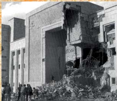
Musée de Bagdad bombardé en 2000

Consultative auprès de l'Unesco, cette association regroupe les principales organisations des professionnels spécialisés dans la conservation de tous les types de patrimoine.