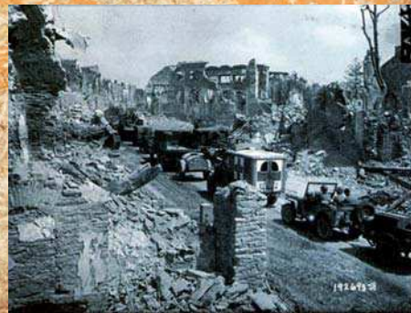
Bataille du Mont Cassin en 1944