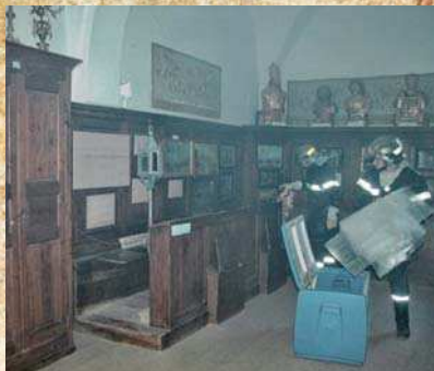
2007 : simulation d'un incendie à Lorgues, évacuation des œuvres