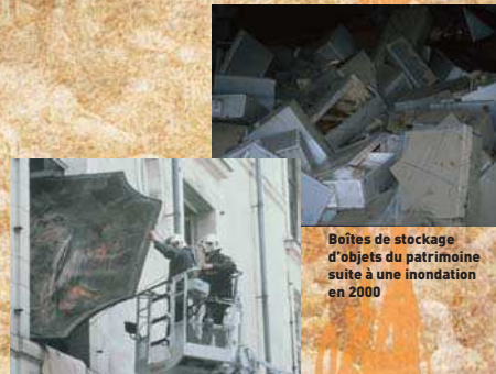
1994 : incendie du parlement de Rennes