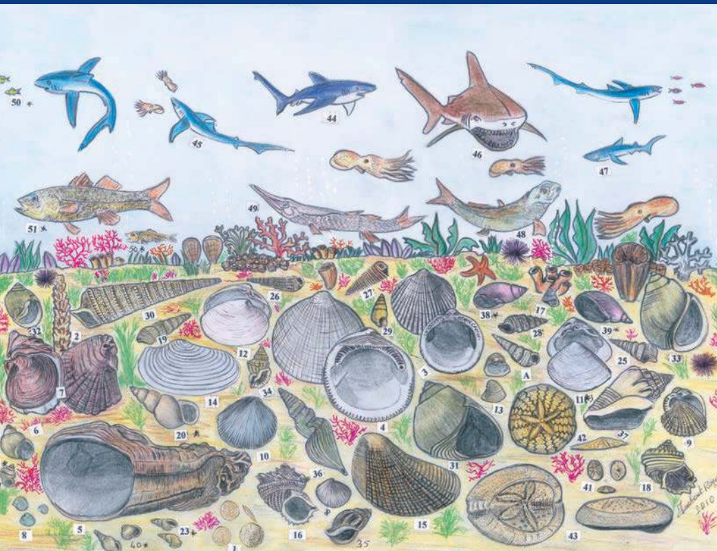
Oligocène -33,9 millions d'années