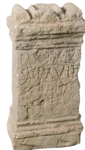
Autel votif dédié aux Dioscures, Castor et Pollux, qui président au commerce, à la guerre, à la navigation et à l'élevage