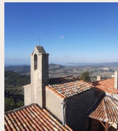
chapelle Notre-Dame du Beausset-Vieux

Beausset-Vieux s'occupe de l'entretien et de l'accueil du public du site.