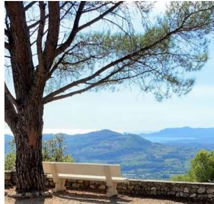
vue sur la baie de La Ciotat