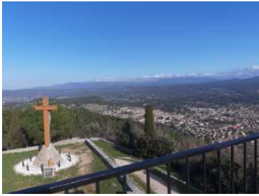
vue sur Le Beausset